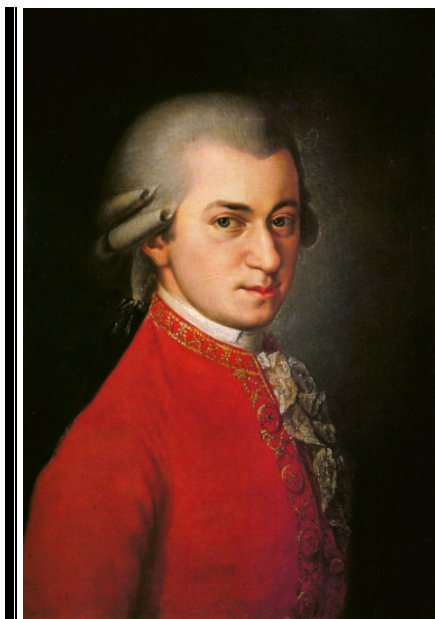
Wolfgang Amadeus Mozart

do Mozart con tan sólo once años, tras haberla escuchado una sola vez, fue capaz de escribir de memoria una obra casi idéntica a la original. El Papa Clemente XIV no lo excomulgó, sino que lo nombró caballero de la Orden de la Espuela de Oro por haber conseguido semejante proeza.