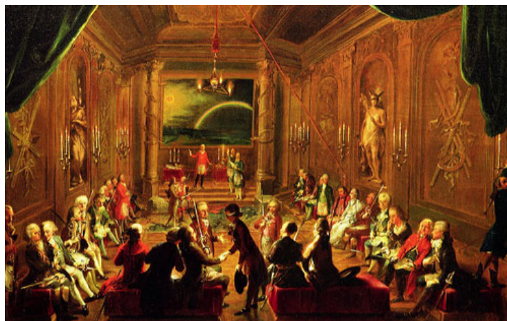
Logia Mozart, en Viena

Como dato curioso, en Madrid está la Respetable Logia Wolfgang Amadeus Mozart, nº 2142 perteneciente al Gran Oriente de Francia.