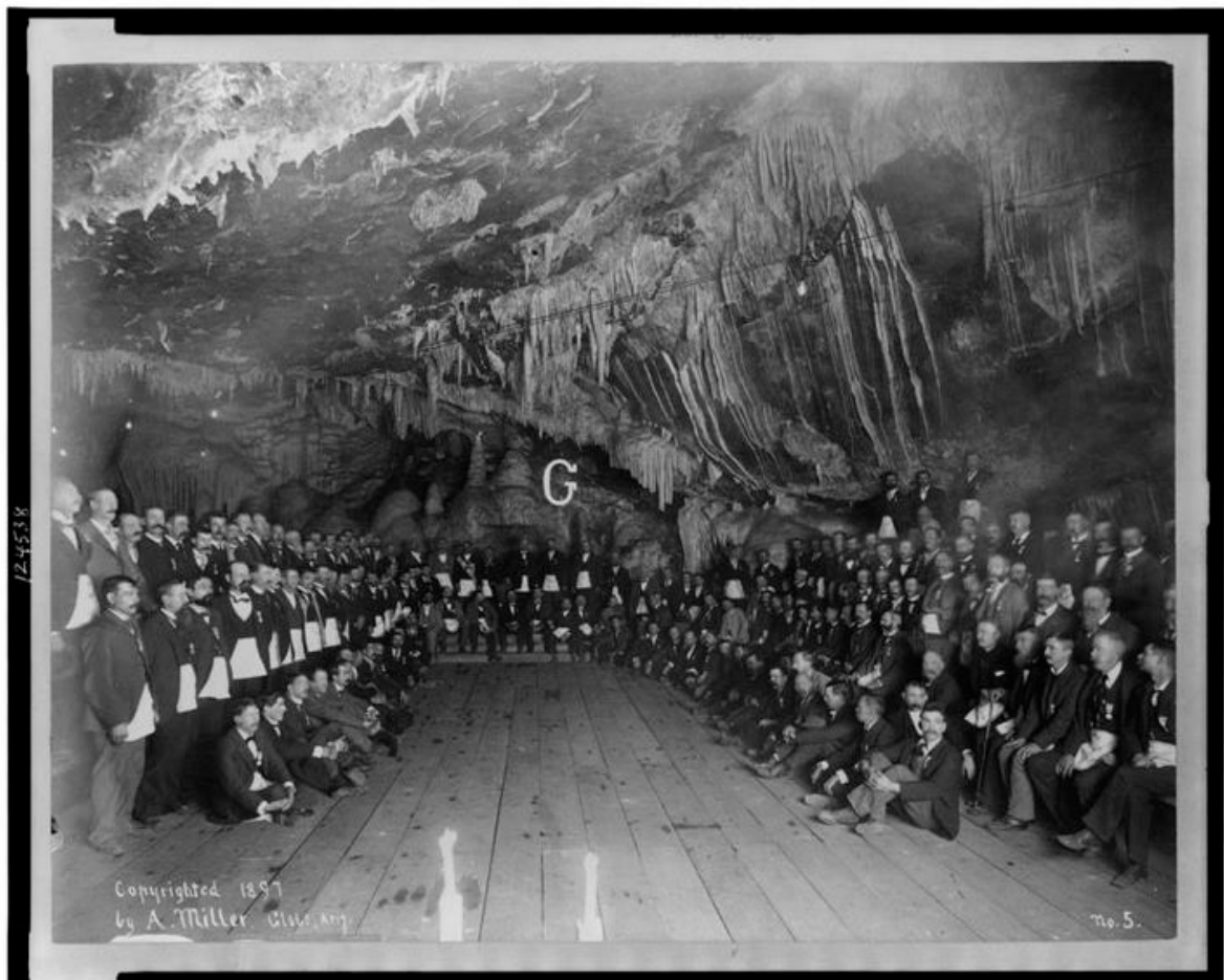
Esta foto fue tomada en una mina de Guarulhos ( Brasil) en el año de 1897

Todos los artículos publicados en esta revista lo son bajo una licencia Creative Commons, puede usted copiar editar y/o modificar el contenido de cualquiera de ellos siempre y cuando cite la fuente original