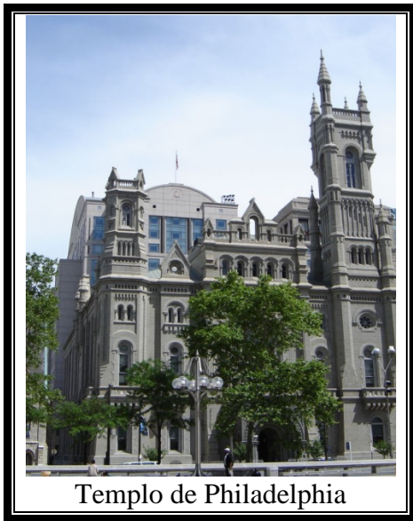
Templo de Philadelphia

Existen muchos escritores e historiadores que afirman que el primer punto donde la masonería puso su pie como tal fue en Pennsylvania. Cuanta la historia que un hombre de nombre William Penn, cuáquero, molestaba un poco al Rey Carlos II y este, para sacarse el lio con la Iglesia que se le venía encima le ofreció un territorio del tamaño de Inglaterra. La única condición es que Penn se fuera a dicho lugar con sus cuáqueros y protestantes donde su culto no levantaría intrigas.