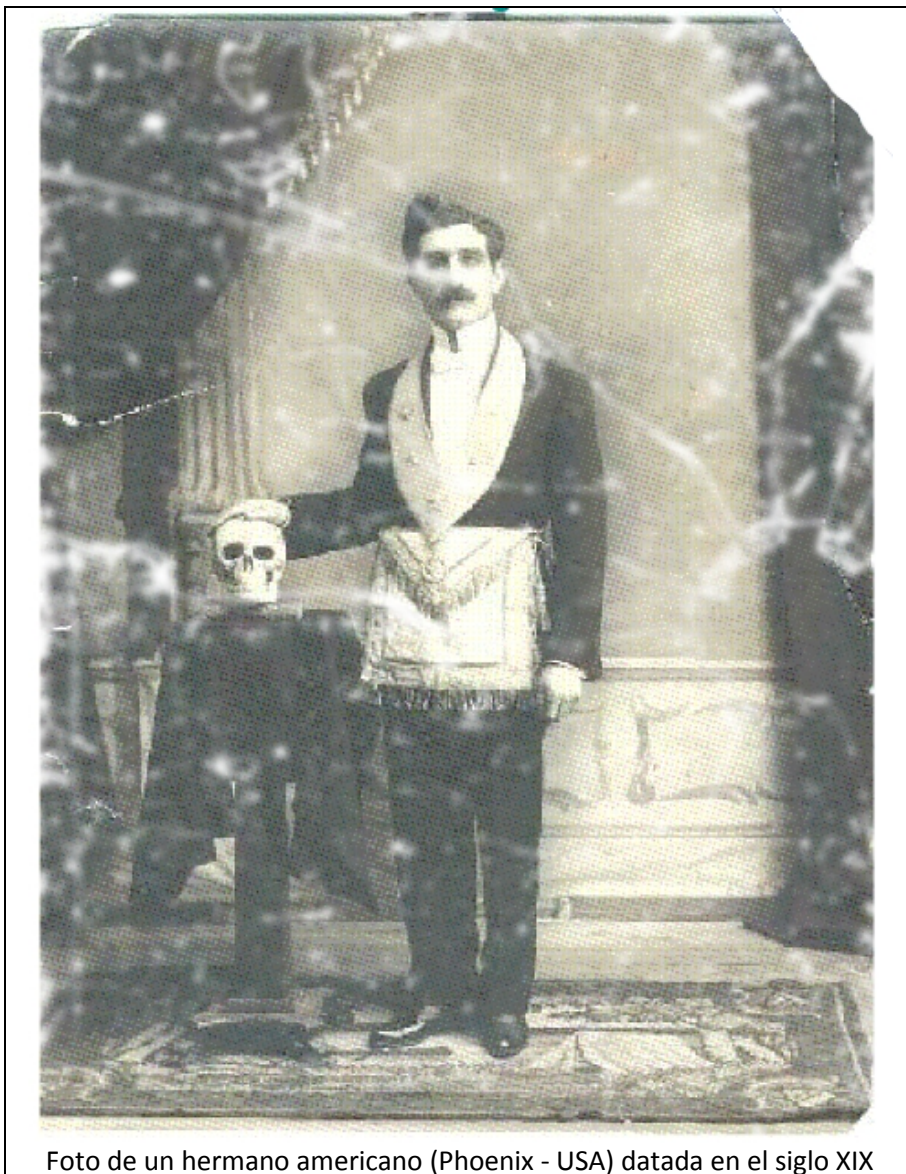
Foto de un hermano americano (Phoenix - USA) datada en el siglo XIX