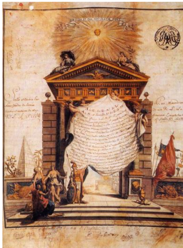
Pasaporte masónico inglés, 1785.