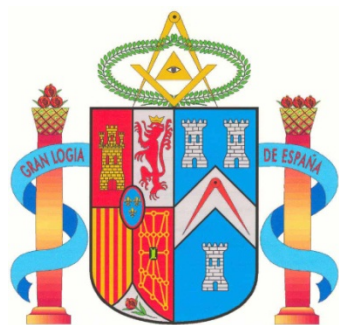
Escudo de la GLE

En el año de 1975 se produce la muerte del General Franco y la subida al poder del estado, como Rey de España de Su Majestad Don Juan Carlos I, se conforma un gobierno de transición que trabaja en busca de unas elecciones y una Constitución. El año 1979 se producen las primeras elecciones generales democráticas en España, que son ganadas por la Unión de Centro Democrático que lidera D. Adolfo Suárez. Se consolida el proceso iniciado de democratización del régimen franquista tras la muerte del Dictador y en 1978 se aprueba la Constitución democrática del Estado Español en una de las mayores participaciones democrática que se conoce, pues hubo más de un 78% de participación. Así mismo, la ratificación dio una base segura a la nueva constitución ya que fue aceptada por un el respaldo del 94,2% de los votantes. A su amparo las actividades franc-masónicas dejan de ser ilegales.