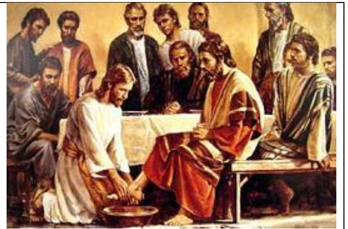
Los más grandes suelen ser los más humildes

- Mi nombre es Abraham Lincoln... y casualmente soy el presidente de esta nación.